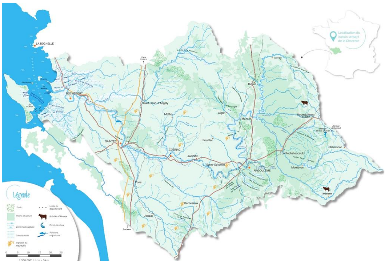
Figure 1 : périmètre de l'EPTB Charente

Le bassin versant de la Charente est un bassin rural situé au nord du district hydrographique Adour-Garonne. Il couvre une superficie de 10 450 km 2 s'étendant sur une partie de la région Nouvelle-Aquitaine et sur six départements : la Charente, la Charente-Maritime, la Vienne, la Haute-Vienne, les Deux-Sèvres et la Dordogne. Le fleuve Charente prend sa source à Chéronnac à 310 m d'altitude, dans le département de la Haute-Vienne. Une pente douce le conduit après 360 km à l'Océan Atlantique, dans le pertuis d'Antioche. Ses eaux sont grossies par 22 grands affluents dont les principaux sont la Tardoire, l'Aume-Couture, la Touvre, l'Antenne, le Né, la Seugne et la Boutonne.