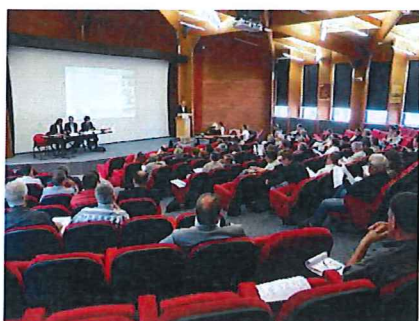
Schéma d'Aménagement et de Gestion des Eaux du bassin versant de la CHARENTE