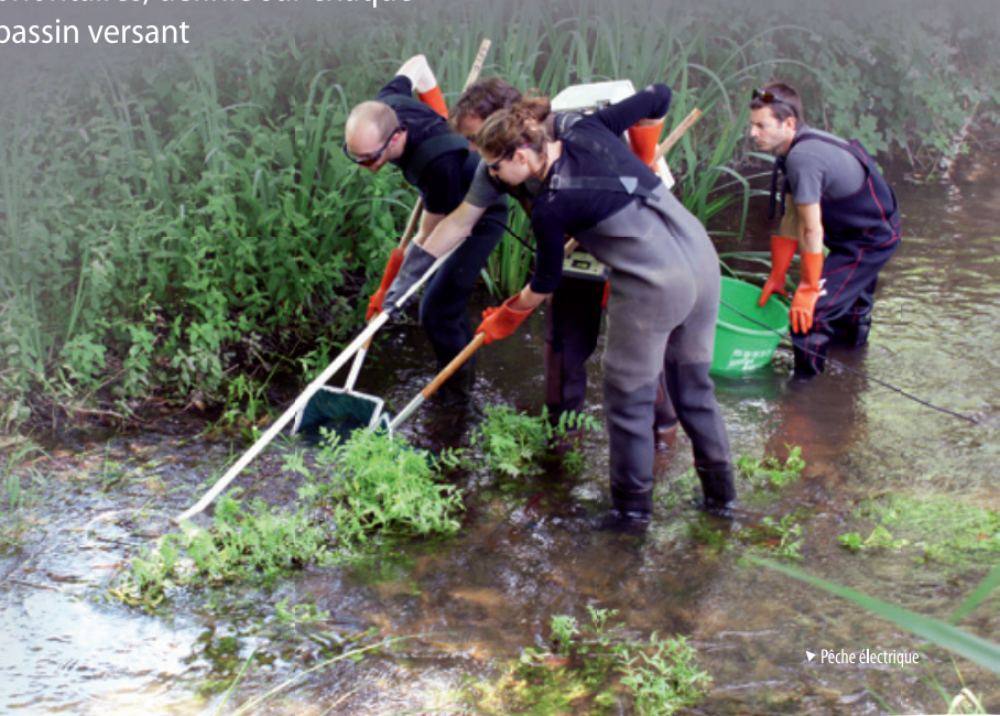
▶ Pêche électrique