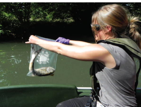
Récupération de cadavres d'alooses

Enfin, la différenciation de l'aire de répartition des deux espèces dans les années à venir est indispensable pour affiner cette analyse et confirmer les résultats apportés par l'étude du suivi de la reproduction qui suggèrent que plus de 75 % des géniteurs sur l'aval de la Charente sont des aloses feintes.