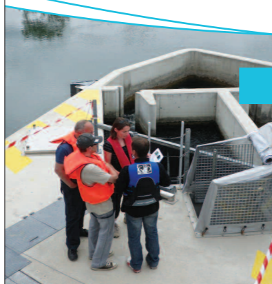
Visite de la station de comptage de Crouin