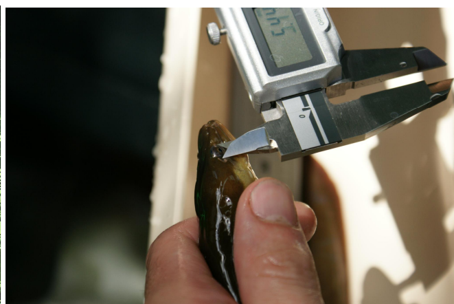
Pêche électrique en 17 (22/06/09)