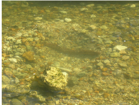
Lamproie marine dans son nid en juillet 2009 en aval Bagnolet sur la Charente

Un suivi de la reproduction de ces deux espèces a aussi été réalisé et semble faire état d'une activité intéressante pour les aloses. Les conditions hydrologiques du printemps n'ont pas facilité les observations de repérage des nids de lamproies marines.